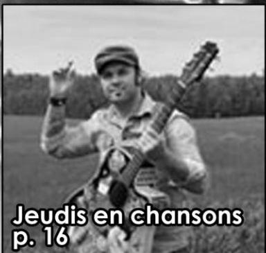
Jeudis en chansons p. 16