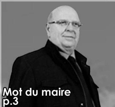
Mot du maire p.3