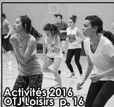
Activités 2016 OTJ Loisirs p. 16