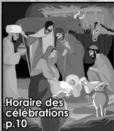
Horaire des célébrations p.10