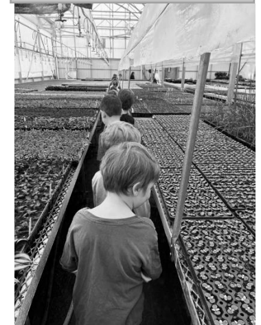
Sortie Serres Francoeur