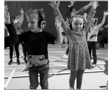
La disco silencieuse