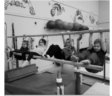
Volet parents et enfants