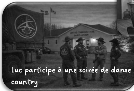
Luc participe à une soirée de danse country

Toutes ces images ont été générées avec l'intelligence artificielle.