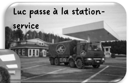
Luc passe à la station-service