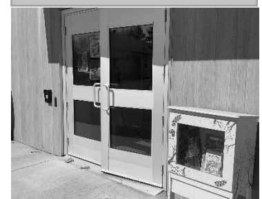
Retour de la Rivia de livres