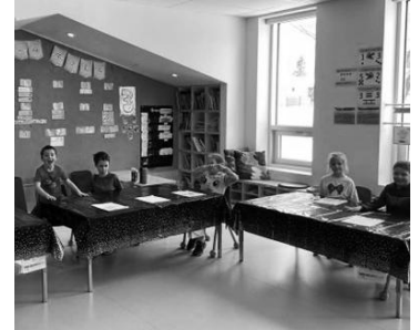
Célébration des auteurs

Cette année, les élèves de 5 e et 6 e année ont l'occasion d'affronter les membres du personnel dans plusieurs disciplines. En février, c'était le match de hockey qui, après une chaude lutte, s'est soldé par une victoire pour les enseignants.