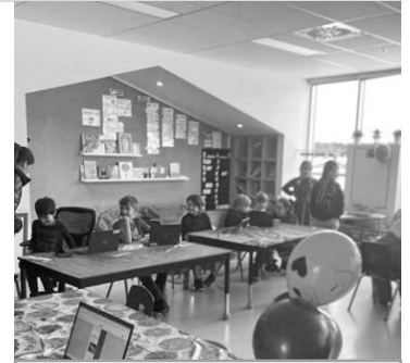
Célébration des auteurs

Le 20 février dernier, les familles étaient invitées à se rendre à l'école pour lire les documentaires préparés par les élèves. C'était la deuxième édition de cet événement et encore une fois il y en avait pour tous les goûts! Les enfants étaient bien fiers des résultats et du grand nombre de visiteurs reçus.