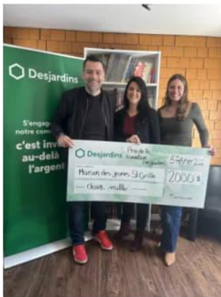
Maison des jeunes St-Cyrille