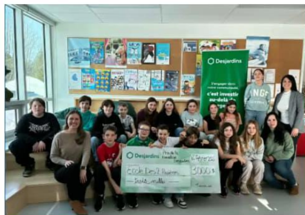
École Des 2 Rivières (Saint-Lucien)

Ces deux projets sont en lien avec la persévérance scolaire et l'accompagnement des enseignants et responsables pour les jeunes. Ils ont reçu un montant pour élaborer leurs projets! Félicitations!