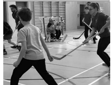
Hockey membres du personnel contre élèves

Avec le retour des écarts de température typiques du printemps, nous rappelons l'importance d'habiller les enfants en « pelure d'oignon », c'est-à-dire en plusieurs couches de vêtements, afin qu'ils puissent retirer ou ajouter une couche selon qu'ils ont chaud ou froid. Les matinées demeurent fraîches et d'importantes variations sont attendues au cours des prochaines semaines; or, les élèves jouent dehors plus d'une heure par jour, et parfois 2 ou 3 heures pour ceux qui fréquentent le service de garde. Nous vous remercions de veiller à ce que votre enfant arrive à l'école habillé adéquatement pour la température et de respecter la charte d'habillement de l'école, afin d'assurer son confort et sa sécurité lors des activités extérieures.