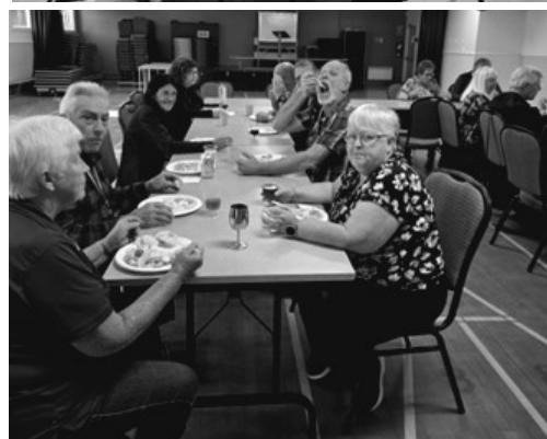
Petit goûter, 3 octobre, pour souligner le début de la saison automne, hiver