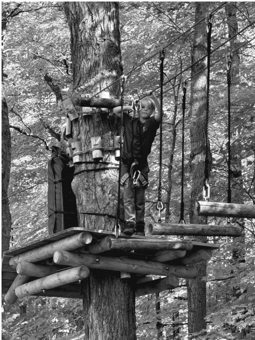
Joshua St-Germain Crédit Photo: Équipe-École

Pour leur première sortie sportive, les élèves de la 3e à la 6e année se sont rendus à Extéria pour tester différents parcours aériens. Chacun a relevé le défi avec courage. Cette activité sportive a permis aux enfants de dépasser leurs limites, tout en s'amusant en plein air.