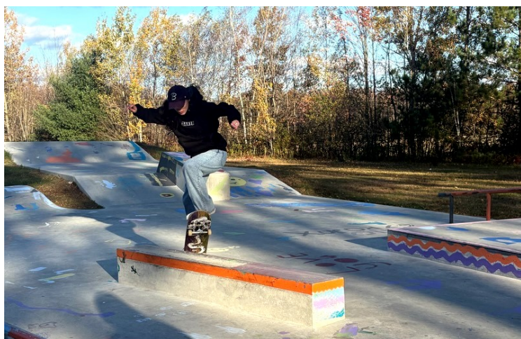
Grande visite de la championne canadienne 2022 : Samantha Secours