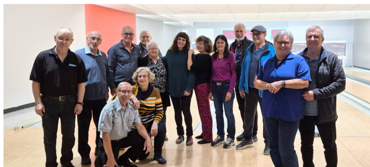
Voici le groupe de joueurs de Quilles! L'activité était ouverte à tous.

En octobre, nous avons eu la chance d'avoir 2 activités MADA (Municipalité Amies des Aînées). En collaboration avec la MRC nous avons eu un café-rencontre où nous avons échangé en groupe sur les préoccupations et enjeux des personnes de 55 ans et plus qui vivent à Saint-Lucien. Il y a aussi eu une activité de quilles organisée par le comité local. Merci à toutes les personnes présentes et aux personnes impliquées qui ont rendu possible ces activités. ■